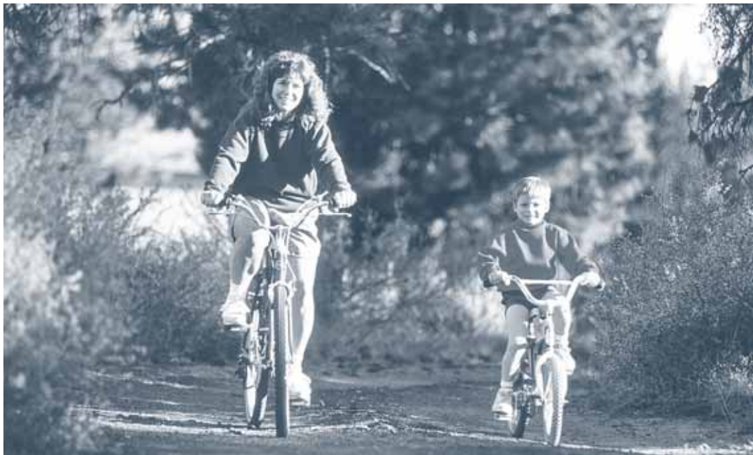
«mit mir» ermöglicht unbeschwerte Augenblicke