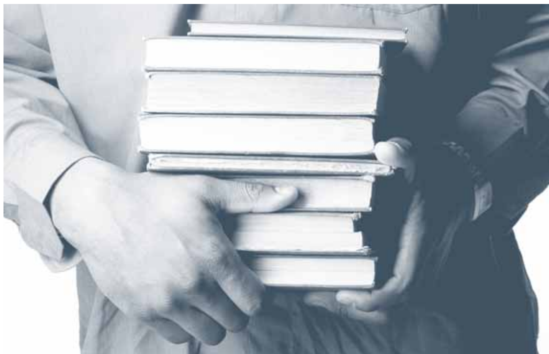
Hochkonjunktur für Publikationen zur Freiwilligenarbeit