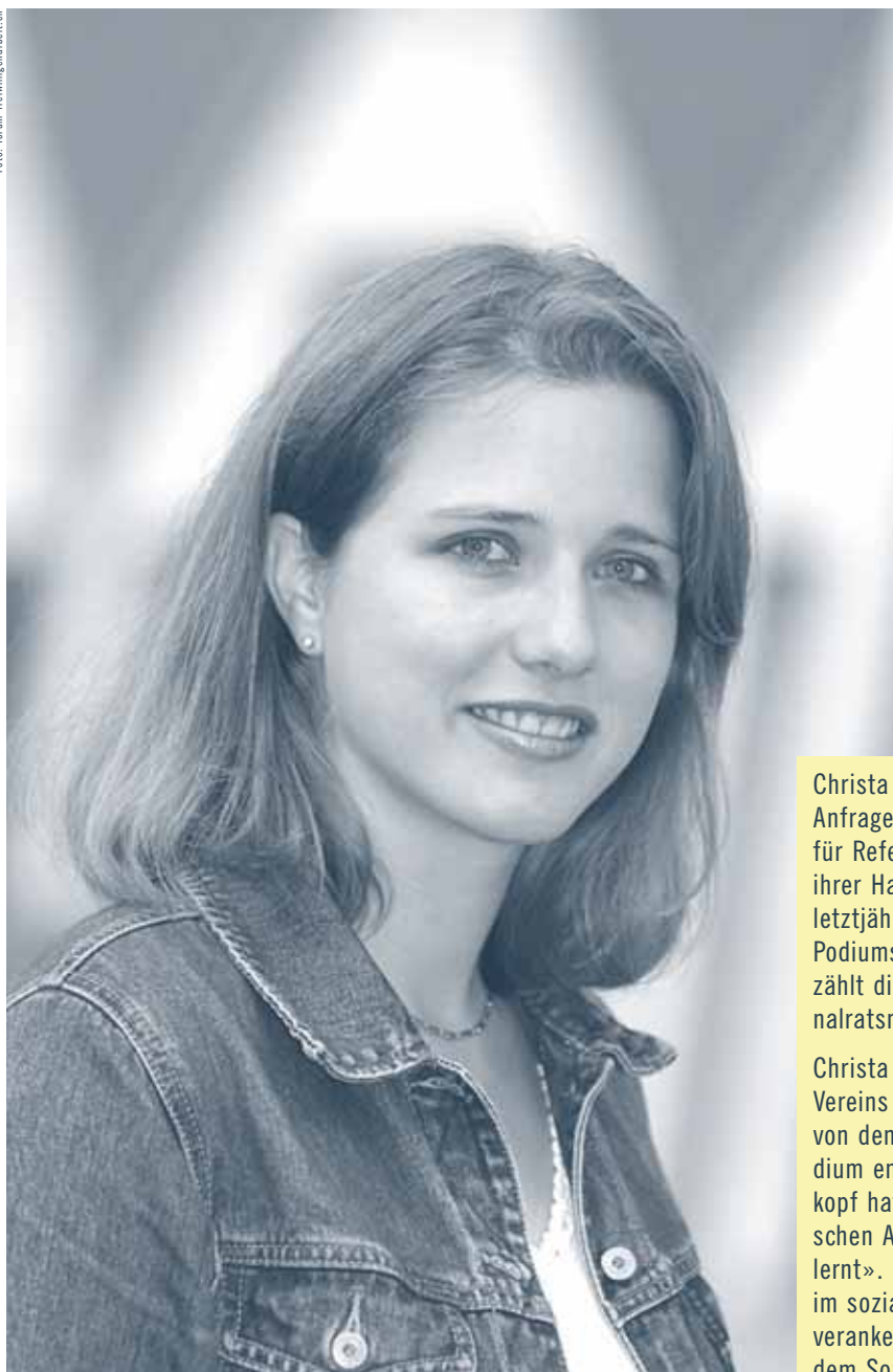
Christa Markwalder – die «höchste» Freiwillige der Schweiz

Junge Parlamentarierinnen in Bern sind rar. Wenn eine davon in der Fraktion mit dem höchsten Altersdurchschnitt auch noch unkonventionell politisiert, fällt sie erst recht auf. Die 29-jährige Berner FDP-Nationalrätin Christa Markwalder hat wenig Berührungspunkte.