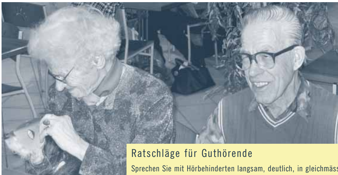
Fasnachtsfeier beim Quartiertreff Wiedikon

Auch der Veranstaltungsausschuss setzt sich aus engagierten Freiwilligen zusammen, die verschiedene Aktivitäten für die Mitglieder durchführen. Der Einsatz mit hörbehinderten Menschen ist anspruchsvoll, denn er fordert von den gut Hörenden viel Geduld, Einfühlungsvermögen und eine sehr deutliche Aussprache.