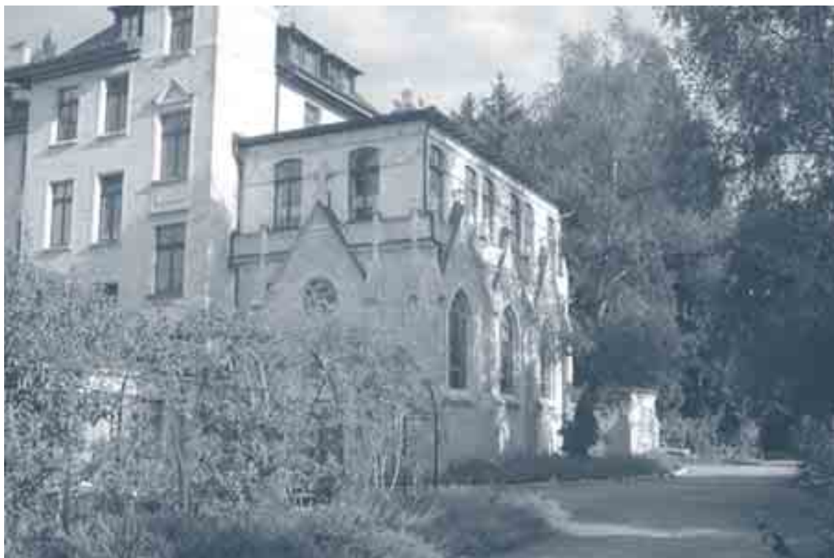
Zentrum Klus: schöne Räume und viele Bäume