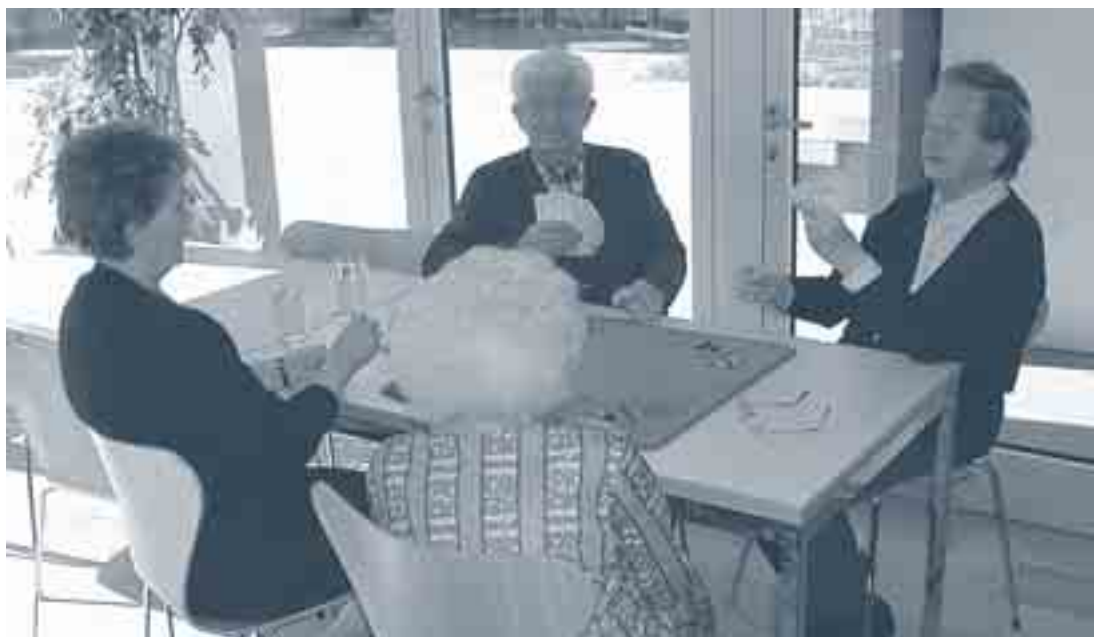
Stöck – Stich – Wiis im Chile-Beizli